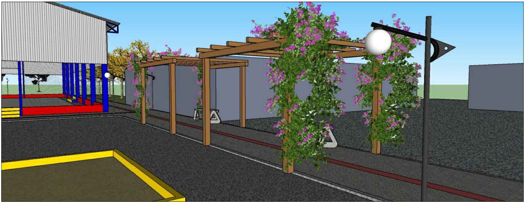
PERSPECTIVA 2 PERGOLADOS