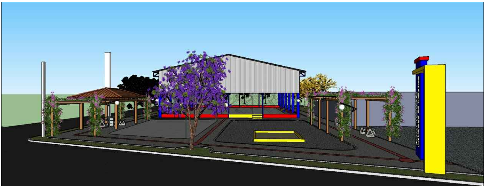
FACHADA AV. VIG. JOÃO CRISÓSTOMO