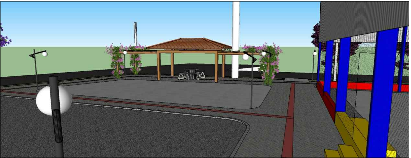
PERSPECTIVA 9 QUIOSQUE