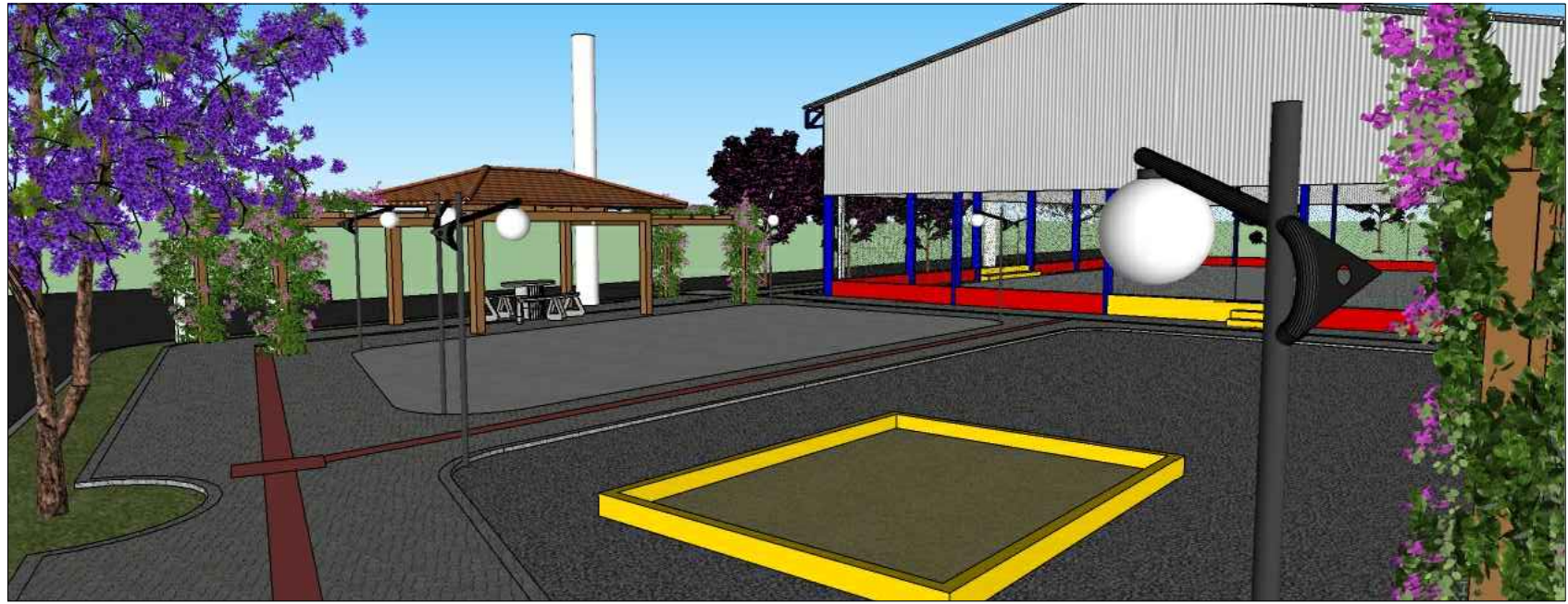
PERSPECTIVA 3 ESPAÇO PARA PLAYGORUND