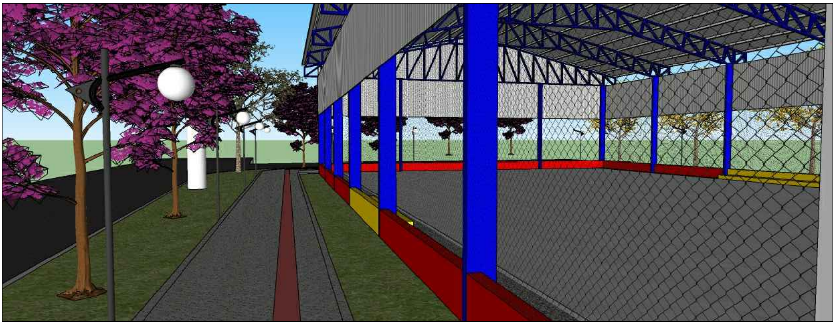
PERSPECTIVA 6 LATERAL