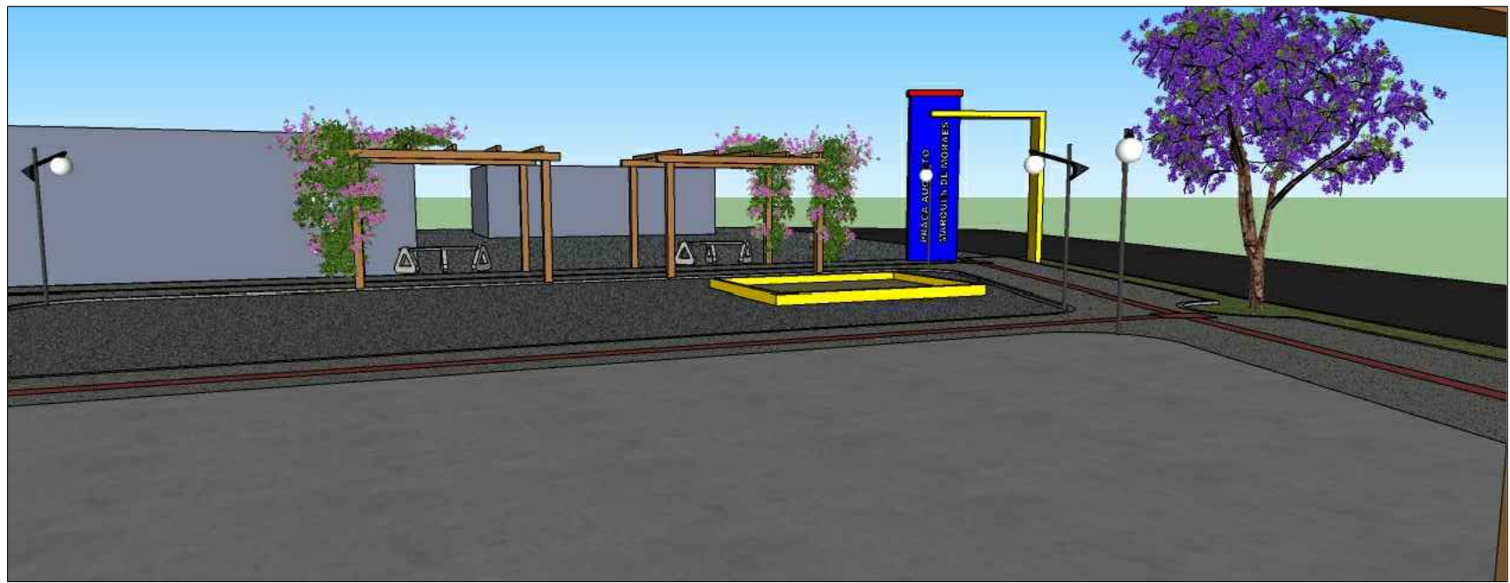
PERSPECTIVA 5 ESPAÇO PARA PLAYGORUND