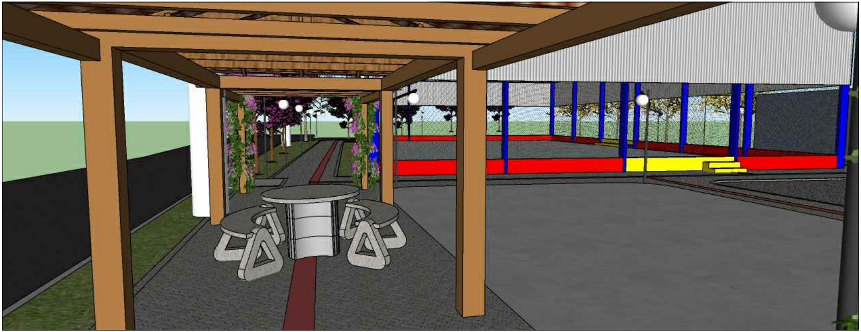
PERSPECTIVA 4 QUIOSQUE