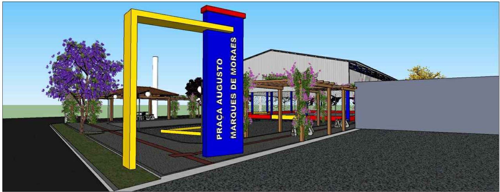
PERSPECTIVA 1 ACESSO - TOTEM