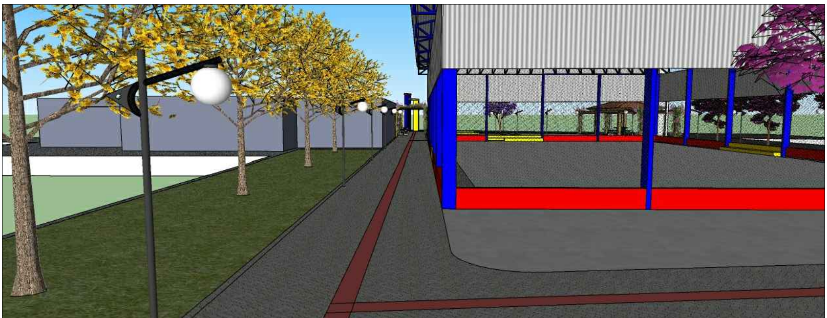
PERSPECTIVA 8 FUNDOS